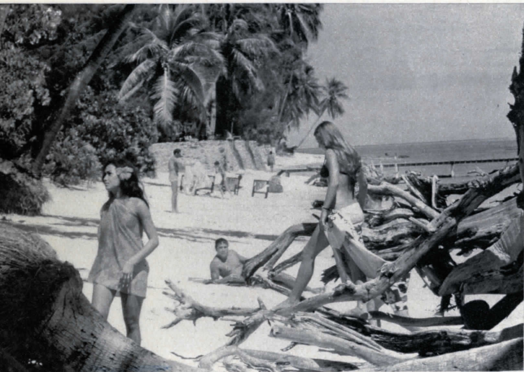
Le spiagge sono costituite di finissima sabbia corallina cui fa da cornice il muro di palme, mentre dal mare giungono a terra rami lavorati dal flutto che completano questa stupenda scenografia. Si va ancora nelle lagune con la piroga, anche se a spingerla è oggi il fuoribordo e non la pagaia, e si balla, sempre, perché ballare vuol dire essere felici. E' il segreto di questa vacanza, che fa dimenticare i problemi quotidiani; per questo ogni partenza è veramente un po' morire.

a bordo, e non appena pronti schizziamo via sull'acqua tranquilla della laguna. Attraverso questo specchio color turchese s'intravedono le formazioni coralline.