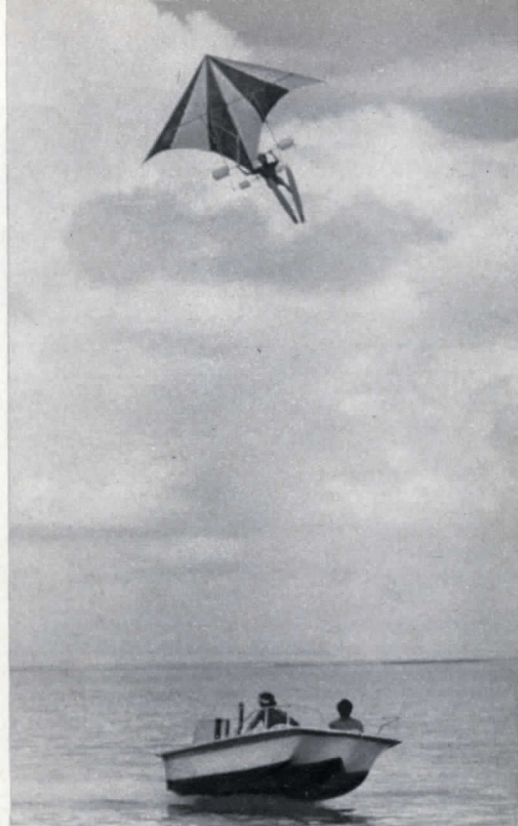
Le attività che si possono svolgere in un luogo come Moorea sono molte: dai giochi all'aria aperta allo sci d'acqua, dalla navigazione a vela alla caccia subacquea, dalla traina di altura alle gite a cavallo, sempre a contatto con una natura splendida, con la presenza costante del mare che offre la sensazione dell'immenso. Nelle foto alcuni momenti di questa vita in assoluta libertà ed un angolo della barriera.