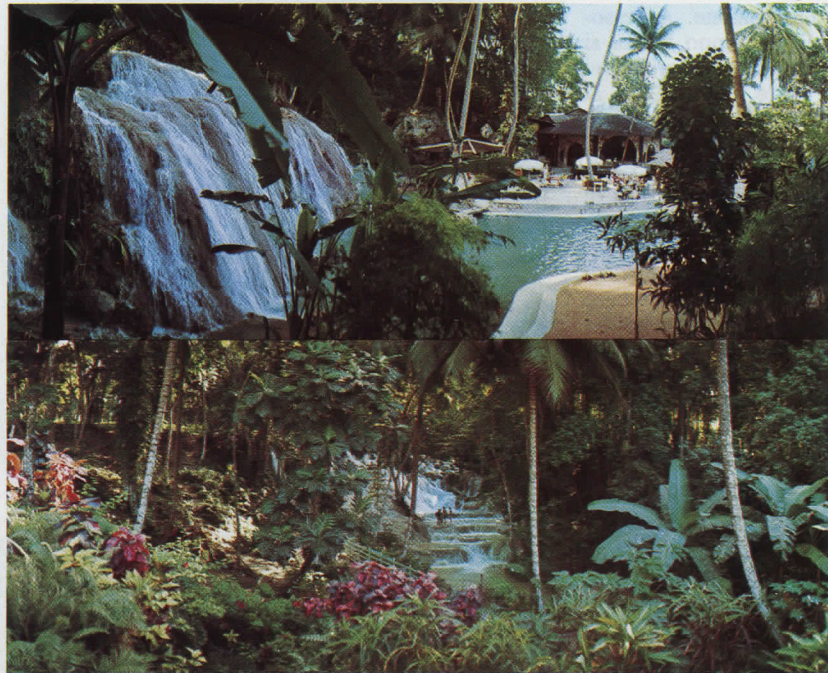
Di fianco: due incantevoli vedute delle scate di Ochos Roca nell'isola di Giamaica. Tutte le isole delle Antille presentano sul versante orientale protetto da venti grandi praterie e coste ricche di acque

Per i pescatori alla traina c'è l'Anchors Aweigh Hotel and Bimini Big Game Fishing Club, dove si possono affittare dei