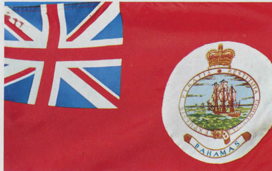
Sopra: i colori della bandiera delle Bahama. Di fianco le piscine dell'East Hill Club uno degli alberghi più confortevoli di Nassau. In basso: i tramonti sul mare nella baia di Bimini.

Come ci si arriva: con la BOAC Londra-Kingston in dieci ore di volo e tappe alle Bermude o a Miami.